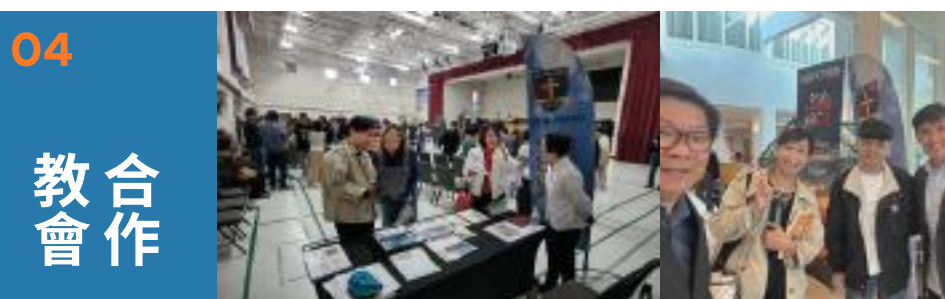
10 / 2025