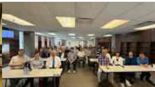
聖經神學研討會 - 與你有約 06 / 2025