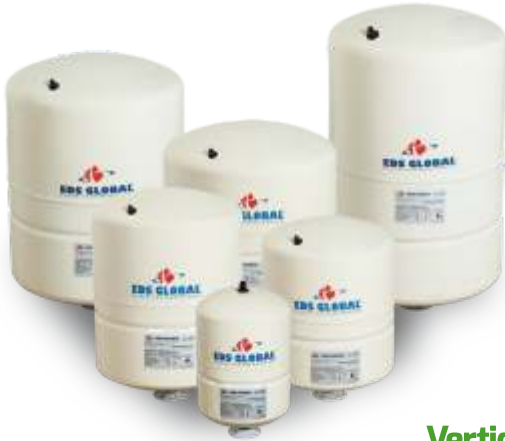
Vertical Tanks Without Leg Dik Ayaksız Tanklar