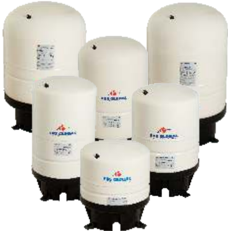
Vertical Tanks with Leg Dik Ayaklı Tanklar