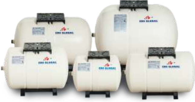
Horizontal Tanks Yatık Tanklar