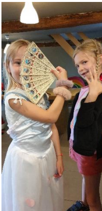
Op een speelse manier wordt het Nederlands versterkt in sport en spel. Kinderen ontdekken hun talenten.