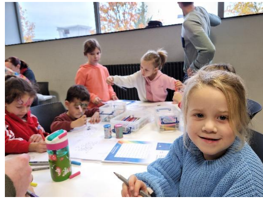
Onze taalrijke workshops zijn vooral gericht op kinderen van 4 tot 7 jaar.