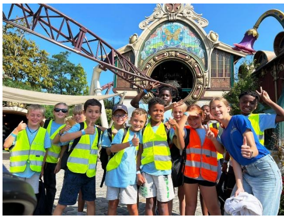
Een geweldige vakantie met leeftijdsgenoten aan een budgetvriendelijke prijs laat iedereen toe om deel te nemen. Ten strijde tegen sociale ongelijkheid.