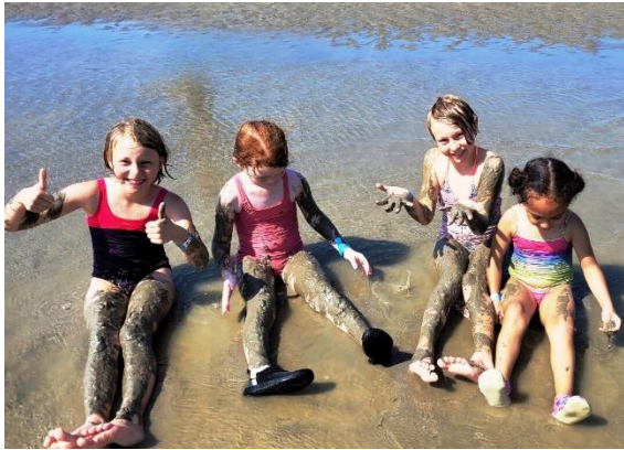
Voor onze taalrijke kansenvakanties (gedurende de zomervakantie) brengen we ons aanbod voor kinderen van 6 tot 13 jaar.

Vitaal wil ook kinderen bereiken die omwille van persoonlijke, familiale of financiële problemen geen kans zien om tijdens de zomervakantie leuke dingen te doen. Bij deze kinderen slaat de verveling al snel toe en raken hun batterijtjes niet opgeladen tegen begin september. Vitaal biedt hen een onvergetelijke vakantie die hen 'klaar boost' tegen het begin van het schooljaar.