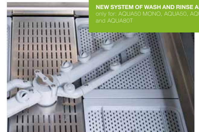
NEW SYSTEM OF WASH AND RINSE ARMS, only for: AQUA50 MONO, AQUA50, AQUA50T and AQUA80T